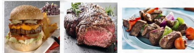
(Photos non contractuelles)

Toutes nos grillades sont accompagnées de pâtes, frites, pommes de terre pêtées (supplément 3€ pour le gratin ou croquettes maison)